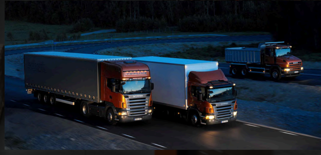
Kara yolu taşımacılığı