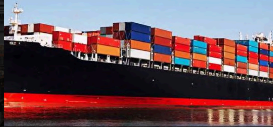
Deniz yolu taşımacılığı

Şirketimiz, müşteri ihtiyaçlarını merkeze alarak kalite, verimlilik ve sürdürülebilirlik odaklı çözümler sunmayı hedeflemektedir. Yenilikçi bakış açımız ve esnek yapımız sayesinde değişen pazar koşullarına hızlı uyum sağlıyor, sade ve sonuç odaklı süreçlerle operasyonel mükemmelliği destekliyoruz. Güvenilir iş ortaklıkları kurarak uzun vadeli değer yaratmayı, güçlü kurum kültürümüzle hem bugünün hem de geleceğin ihtiyaçlarına katkı sağlamayı temel fokusumuz olarak benimsiyoruz.